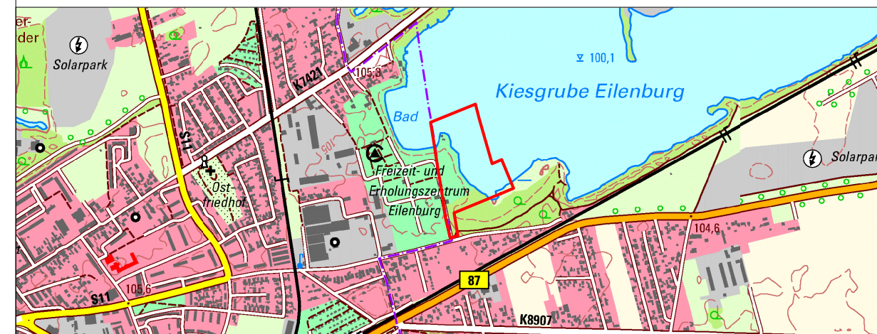
Übersichtskarte, Maßstab 1 : 20.000