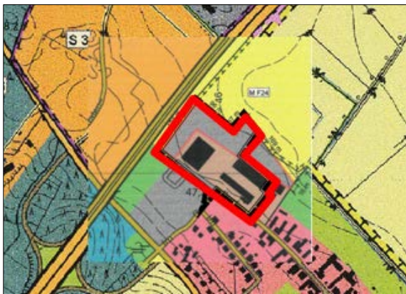
Abb. 1 wirksamer FNP

Darüber hinaus wird in der 7. Änderung des Flächennutzungsplanes der Gemeinde Linthe ein Einzelhandelsstandort ausgewiesen.